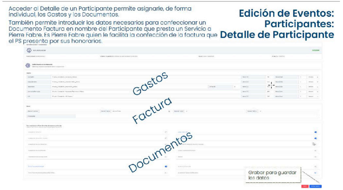
Fig.3 Incorporar los gastos y documentos para cada participante

A continuación, se asigna de forma individual para cada participante, las transferencias realizadas, en los diversos apartados como formación, inscripción reuniones, honorarios, gastos desplazamientos y los documentos justificativos tales como contratos y facturas (Fig. 3)