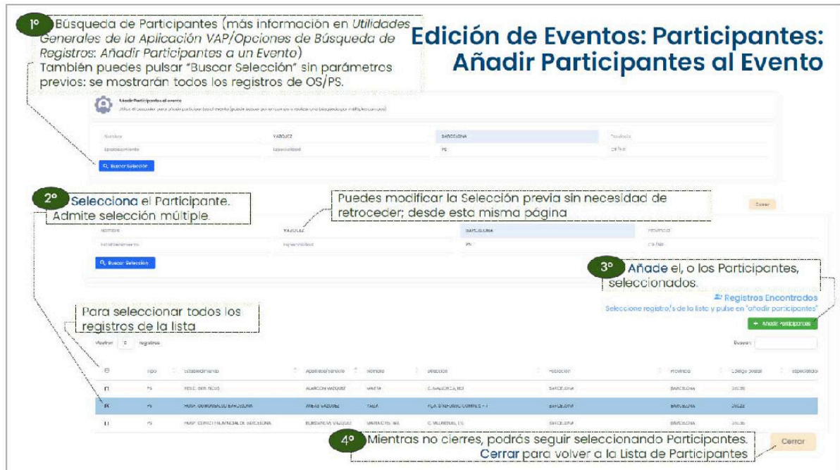
Fig.2 Incorporar participantes a un evento

A continuación, se asigna de forma individual para cada participante, las transferencias realizadas, en los diversos apartados como formación, inscripción reuniones, honorarios, gastos desplazamientos y los documentos justificativos tales como contratos y facturas (Fig. 3)